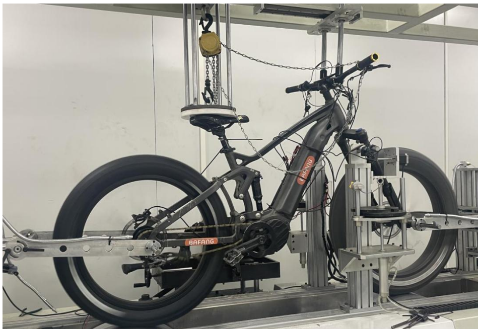
图片：G500A 模拟负载测试

八方电气（苏州）股份有限公司 江苏省 苏州工业园区 东堰里路6号 邮编 215125