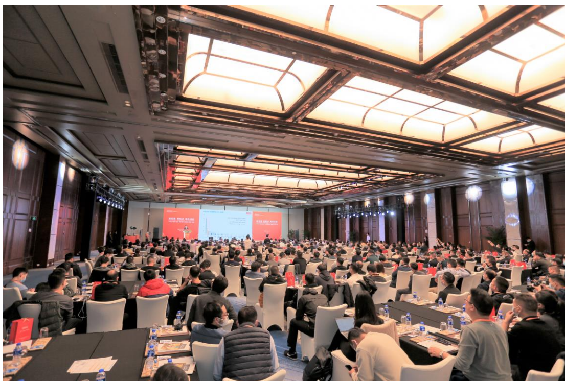
八方电气第六届电助力自行车驱动系统技术交流会

2022年11月17日，以“新征程 新起点 扬帆远航”为主题的八方电气第六届电助力自行车驱动系统技术交流会在苏州金鸡湖畔召开，受疫情影响一度停办的八方技术交流会再次亮相，受到了行业广泛关注。八方的合作伙伴代表、检测认证机构代表、媒体代表 400 余人济济一堂，共同参加此次盛会。