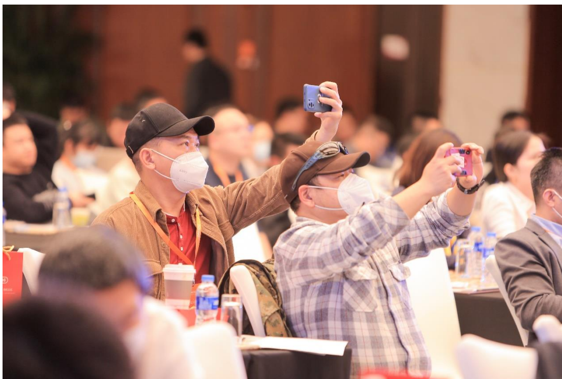
八方电气第六届技术交流会活动现场

11月18日，基于前一日深入的市场与技术分享，八方还组织了与会嘉宾共同前往八方新能源工厂、八方总部进行参观与样车试骑，通过近距离感受展厅、产线、实验室、仓库等场景的真实情况，让更多的客户进一步加深了对八方生产制造环节的了解，为将来双方紧密良好的合作关系奠定了坚实的基础。