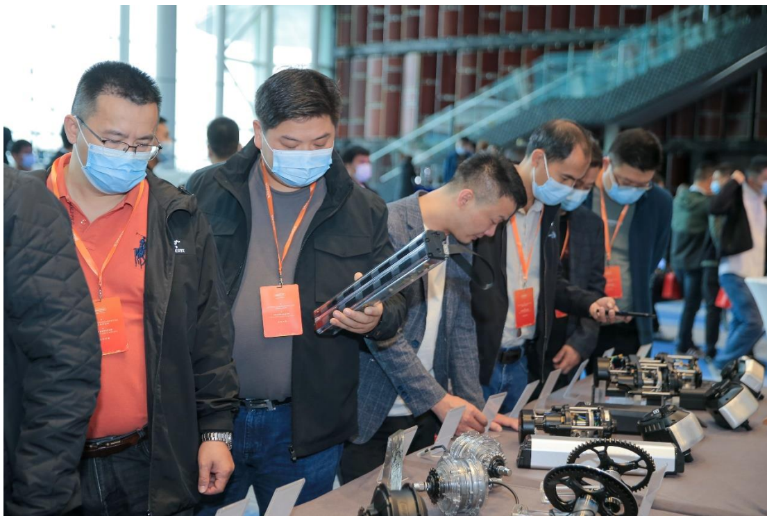
八方电气第六届技术交流会样品展示区

八方电气（苏州）股份有限公司 江苏省 苏州工业园区 东堰里路6号 邮编 215125