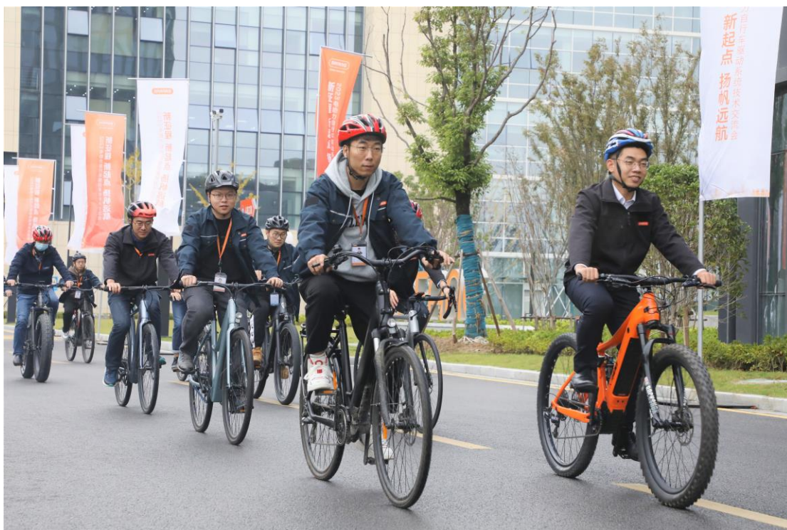
参观八方总部与样车试骑活动

八方电气（苏州）股份有限公司 江苏省 苏州工业园区 东堰里路6号 邮编 215125